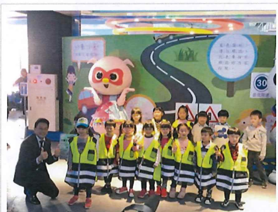
交通局長葉昭甫出席中市首座兒童交通安全教育館啟用典禮

社團法人中華車會與麗寶國際賽車場合作打造台中第一座「兒童交通安全教育館」，引進歐盟認證的兒童小汽車，透過實際體驗幫助兒童認識道路安全知識，今(13)日市府交通局長葉昭甫出席啟用典禮，肯定中華車會與麗寶國際賽車場用心規劃，寓教於樂提升兒童交通風險感知能力，與市府一同守護兒童安全。