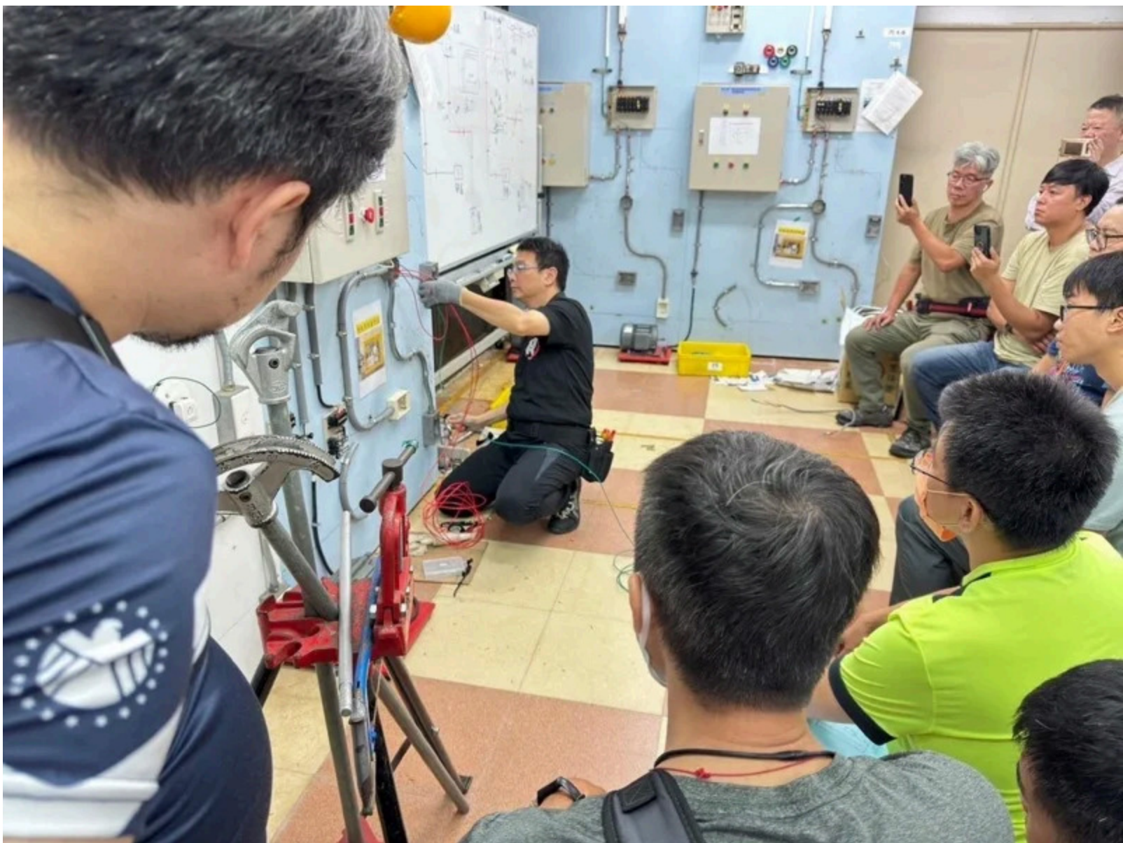
東南科大開設丙級室內配線實體解說。圖／新北教育局提供

台北海洋科技大學則因應台灣社會的高齡化趨勢，開設樂齡健康促進指導員36小時培訓班，共訓練18名學員，未來結訓後可以從事以銀髮樂齡為對象等職務，包含專案企劃、課程規劃與教案設計、健康指導、輔具設計行銷人員到休閒規劃人員。